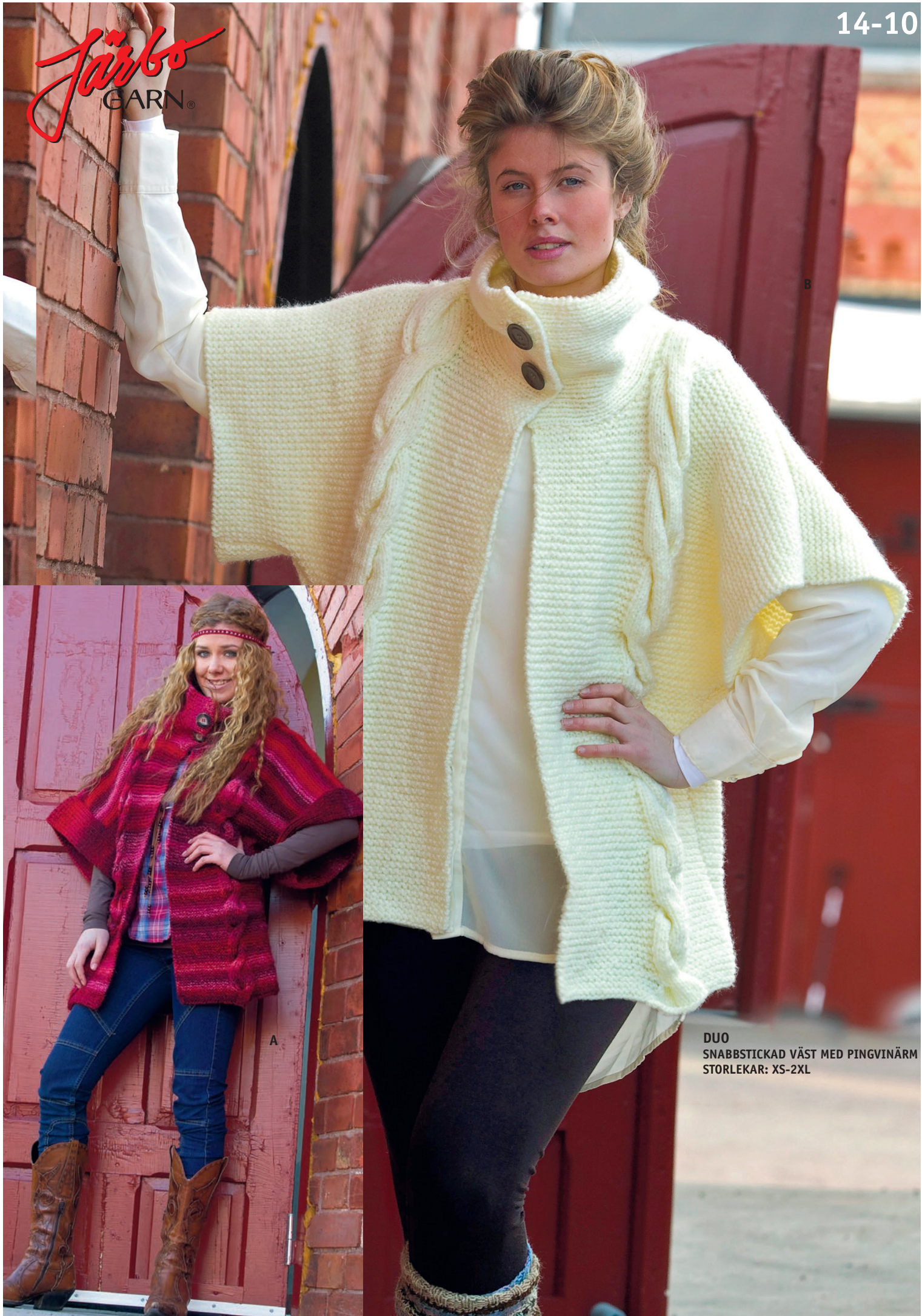
DUO SNABBSTICKAD VÄST MED PINGVINÄRM STORLEKAR: XS-2XL